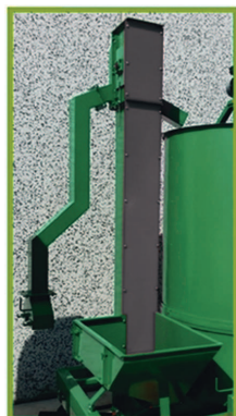
Opción de carga, descarga y mezclado del fruto