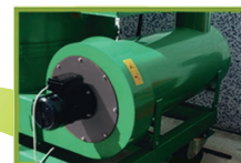
Potente generador de calor