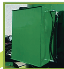
Tanque de combustible